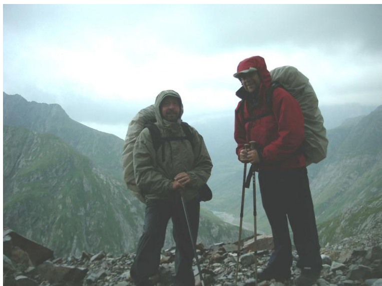
Door de mist, door de regen

Mist, regen, hagelstenen en af en toe een bliksemschicht met bijhorende knallende donderslag vergezellen ons. Voorbij de 'Grottes d'Bellevue' (schuilplaatsen uitgehouwen in de rotswand op 2420 m hoogte) verandert het karakter van de afdaling. We lopen rechts van een ravijn, mogen nu en dan klauteren over de nu gladde stenen en dwarsen meerdere sneeuwveldjes. Het smal ravijn verbreedt zich tot een vlakte: de 'Oulettes d'Ossoue' (1866 m), die afgesloten is door een stuw (1825 m). We laten de gemakkelijke weg naar Gavarnie links liggen en stijgen eventjes naar de 'Cabane de Lourdes' (1974 m). Hier verlaten we de GR10. Door