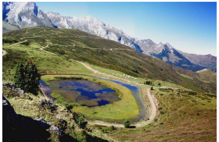
Zicht vanaf de Col de Soum

Door de weiden en langs een berggriviertje beginnen we de afdaling naar Arrens-Marsous (878 m).