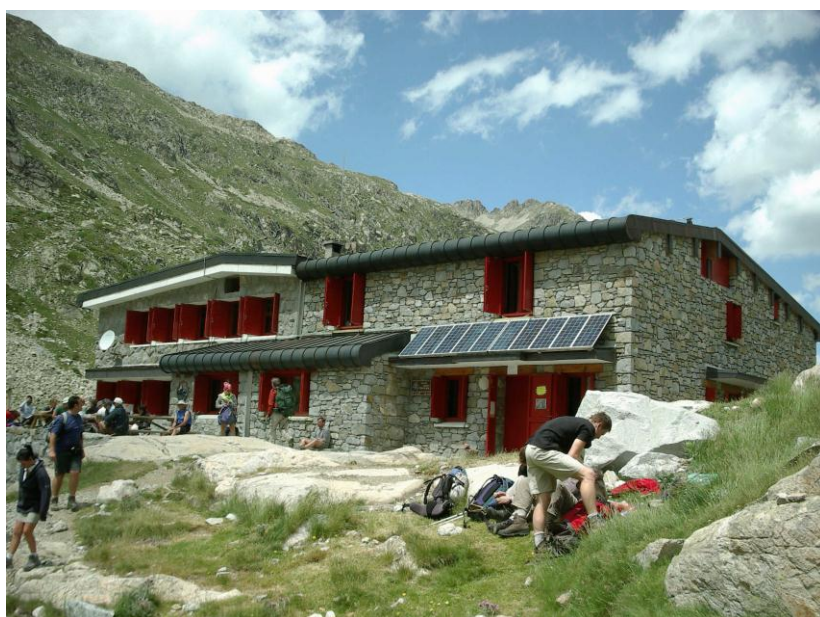
Refuge d'Oulette de Gaube

Het zicht is adembenemend. In het zonnetje is het lekker warm maar af en toe laat een kille wind van over de gletsjer ons naar adem happen. Van rechts zakt een sliert trekkers van de 'Col des Mulets'. Het zijn Vlamingen die aan een bergtrekking deelnemen georganiseerd door "Te Voet". Een van de deelnemers denkt dat hij een ijsbeer is want hij trekt zijn zwembroek aan en springt in het ijskoude gletsjerwater. Wat later is hij weeral op stap om de gletsjer eens van dichtbij te gaan bestuderen. Macho. Om 17 u kunnen we met onze bagage naar de slaapzaal. Er kunnen hier meer dan 100 mensen overnachten maar er zijn geen douches. Een kattenwasje moet volstaan.