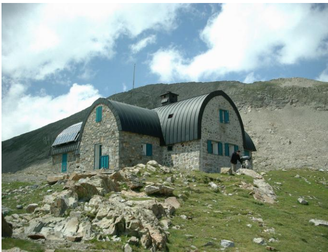
Refuge de Baysellance

Vandaag hebben we als rustdag uitgeroepen, dit betekent dat we maar enkele uren moeten stappen. We zitten weeral in de wolken, het zicht is minimaal. We wachten een uurtje, het betert niet dus moeten we vertrekken. We stijgen tot op de hoogte van de gletsjers en gelukkig voor ons trekken de wolken nu en dan even op zodat we de ijsmassa's kunnen bewonderen. In brede lussen bereiken we de 'Hourquette d'Ossoue (2734 m), de Petit Vignemale is nog in wolken gehuld dus laten we die nog eventjes rechts liggen. Voor ons in de diepte zien we reeds de 'Refuge de Baysellance' (2651 m). Dit is de hoogst gelegen refuge in de Pyreneeën en ons eindpunt van de dag. De gîte heeft een gebogen dak als het schild van een schildpad. Daar aangekomen zetten we ons in het schaarse zonnetje en bewonderen we de ruwe omgeving. Het is een voortdurend komen en gaan van trekkers.