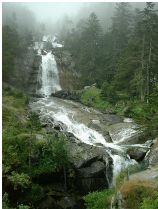
Naar de Pont d'Espagne