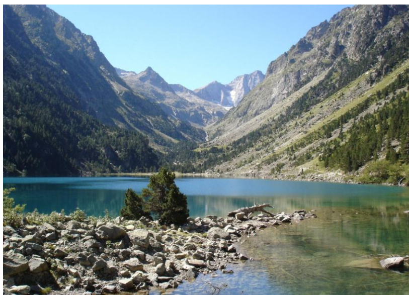
Lac de Gaube