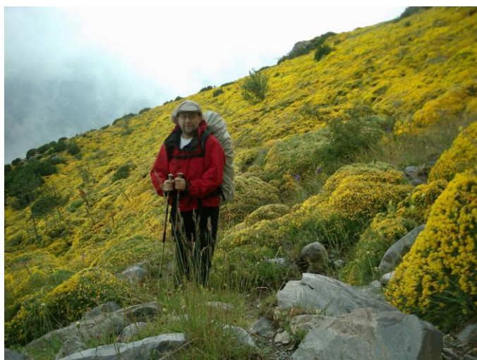
In de brem

de nauwe vallei van de 'Ruisseau de la Canau' stijgen we naar de 'Col de Bernatoire' (2393 m). De zon is te voorschijn gekomen, het pad richting Spanje loopt lekker en de omgeving is prachtig. Naar het einde toe wordt het pad behoorlijk steil en komen we weer in de wolken terecht. Gelukkig wijzen steenmannetjes ons de weg. Boven trekken de wolken eventjes open en zien we beneden ons eventjes het 'Lac de la Bernatoire' (2275m). Het is een klein rond meer dat in een kom ligt en van vulkanische oorsprong is. We dalen af naar het Lac maar de wolken sluiten zich opnieuw. Aan de andere kant van het Lac gaan we de Col over en lopen we Spanje in. De mist is hardnekkig en we moeten meer raden waar het pad is dan dat we het zien. Daarenboven is de berghelling flink geërodeerd en moeten we zelf maar zien hoe we verder beneden komen. We zakken een honderdtal meter en de zon komt weer te voorschijn.