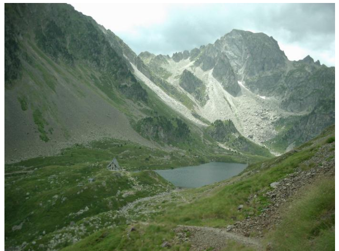
Lac en Refuge d'Ilhéou

We dalen nog een flink eind en komen terug op de weg. Duim omhoog, jeepje stopt, in de koffer tot aan de 'Lac d'Estaing' (1161 m). Vanaf hier is het klimmen geblazen. Door het bos bereiken we, langs een zeer steil rechtuit-rechtaan-pad, de 'Cabane d'Arriousec' (1400 m). Ons pad wordt nu gelukkig wat minder steil en langs een beekje komen we bij de 'Cabane de Barbat' (1850 m). De brug is ingezakt en na wat evenwichtsoefeningen kunnen we verder. In grote lussen, gemarkeerd door GR-tekens en mannetjes (steenhoopjes die de weg aangeven) komen we op de brede 'Col d'Ilhéou' (2242 m). Van voor ons op de kam komt een stroom toeristen ons tegemoet. Zij zijn juist aangekomen met de zetlift vanuit Caunterets. We dalen af en over een pad 'en balcon' komen we bij het 'Lac d'Ilhéou' (1975 m). We zijn in het 'Parc National des Pyrénées'. In de bijhorende refuge kunnen dranken en snacks besteld worden, het terras zit dan ook stampvol. Het is pas 13 u, we mogen enkel binnen om 17 u. Er zit niets anders op dan te wachten, we trekken trui en jas aan en bestellen een assortiment lokale charcuterie. De mist daalt neer, een snijdende wind steekt op, het wordt bitterkoud.