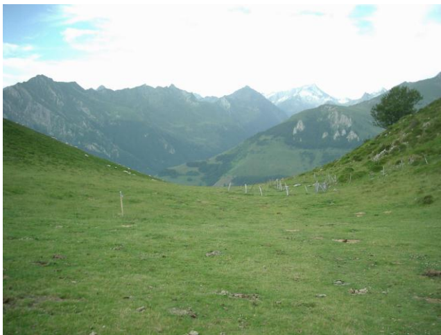
Col de Bazès

We volgen eventjes de jeepweg maar slaan vervolgens een pad in dat ons door het bos omhoog leidt naar de 'Col de Bazès' (1509 m). We wandelen er in het gezelschap van paarden en koeien. We dwarsen een weg en stijgen verder naar de 'Col de Berbeilles' (1633 m). We steken over naar de andere flank en lopen er hoog boven het dal ('t is nu niet het moment om last te krijgen van hoogtevrees) naar de 'Col de Cantau' (1543 m). Beneden ons zien we een kudde rood beschilderde schapen. De kleur laat de herder toe zijn schapen van ver te herkennen. Op de col nemen we weeral een ander pad dat ons naar de 'Col de Soum' (1530 m) brengt. Een schare toeristen komt ons tegemoet om het meertje te bewonderen. Op de 'Col de Soulor' (1447 m) is het rustpauze. Deze col ligt aan de toeristische weg naar de col d' Aubisque en het is er behoorlijk druk. Er zijn meerdere terrasjes en kraampjes met kaas en andere streekspecialiteiten. Na de terrasstop trekken we quasi horizontaal naar de 'Col de Saucède' waar we de GR10 vervoegen.