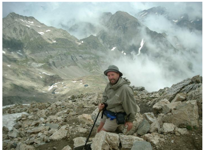
Op de Petit Vignemale

De refuge is de ideale startplaats van de beklimming van de Vignemale (3298 m) via de gletsjer van Ossoue. Velen hebben dan ook ijshouwelen, klimijzers, een helm en touwen aan hun rugzak hangen. We eten een omelet met spek en uiringen, nemen onze wandelstokken en vertrekken voor de beklimming van de Petit Vignemale (3032 m). De top is nog altijd in wolken gehuld maar we hebben goed zicht en af en toe komt ook de gletsjer even te voorschijn. We zien duidelijk de sporen van de ijsklimmers.