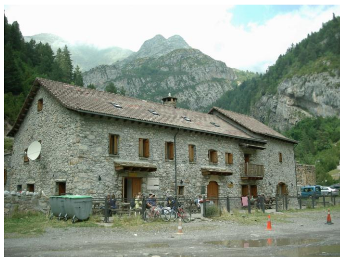
San Nicolas de Bujaruelo

Eenmaal op de vlakte zien we voor ons een berghelling die letterlijk geel is van de bloemen. Het betreft hier waarschijnlijk een soort brem. Het geel is gespikkeld met het blauw van irissen. Buitengewoon prachtig; dit loont zeker alle moeite die we gedaan hebben om hier te geraken. Een brokkenpad waarlangs ook de koeien de weide bereiken (strontwegel) sluit de afdaling naar 'San Nicolas de Bujaruelo' (1300 m). Dit is een camping met bijhorende refuge in de vallei van de Rio Ara. We hadden gereserveerd en een voorschot betaald maar blijkbaar weten ze van niets. Dit wordt moeilijk discussiëren want ik ken geen Spaans en de ander kent slechts een beetje Engels. Als de verantwoordelijke voor de refu-