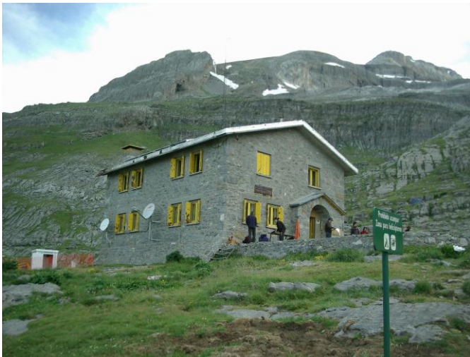
Refuge de Gorize

We ontbijten pas om 7.30. Ik heb slecht geslapen, ik heb een waslijst pijnlijke plekjes, de stemming is in mineur.