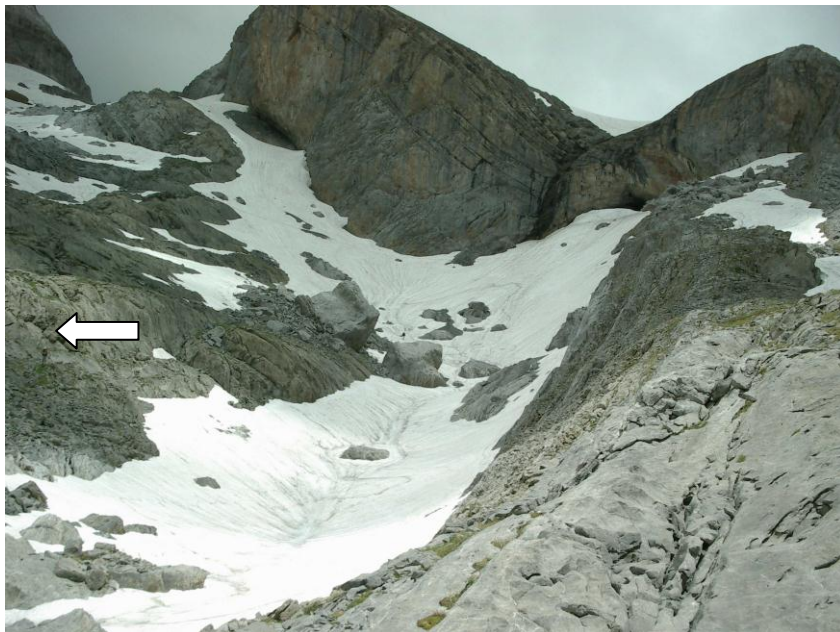
Na mijn glijpartij; terug veilig op de rotsen.

Jépé steekt over terwijl ik de man uitleg dat het nog een heel eind door de sneeuw is tot aan Breche. Jépé is aan de overkant en de beide trekkers overleggen hun verdere stappen. Ze besluiten terug te keren waarna ik aan de oversteek begin. De sneeuw is hard bevroren, de helling is zeer steil. Voor ik het beseft glijd ik uit en ben ik op mijn achterwerk met een rotvaart op weg naar beneden. Er ligt een grote rotsblok op mijn weg, een crash is onvermijdelijk. Ik kan gelukkig voldoende remmen om zonder al te veel kleerscheuren te landen. Ik klauter op het blok en stel vast dat ik op een eiland zit.