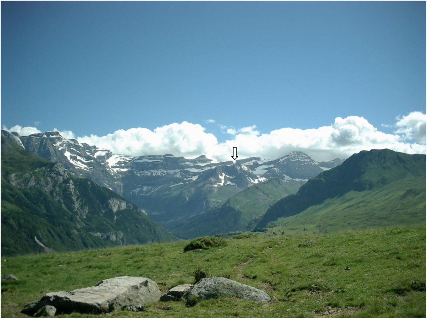
Ons doel: de Brèche de Roland (pijl)

opnieuw een smal paadje dat ons eerst omhoog zendt door de weiden om dan steil verder omhoog te kronkelen. Wat verder mogen we warempel horizontaal in de flank van de berg verder wandelen door het naaldbos van Bué; een verademing. We stijgen nog even tot de 'Croupe de Pouey-Boucou' (1874 m) en mogen dan afdalen tussen de jeneverbesstruiken en de heideplanten door. Deze staan zo dicht bij elkaar dat ons pad amper nog een voet breed is en meestal onzichtbaar. We struikelen meerdere keren over wortels en worden geregeld geschramd. Op de 'Col de Suberpeyre' (1725 m) kunnen we een eerste blik werpen op de 'Cirque de Gavarnie' en de 'Brèche de Roland'. We dalen langdurig af in de vallei van de Aspe tot aan het brugje waarna we op de andere flank terug kunnen stijgen. Het terras van de Gîte d'étappe de Saugué (1610 m) is een welgekomen rustplaats.