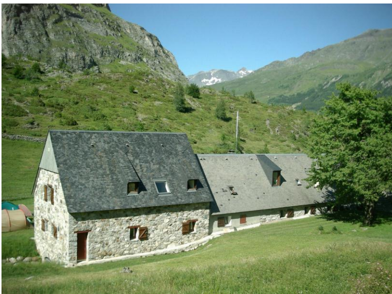
Refuge des Granges de Holle

We vervolgen onze weg nagenoeg horizontaal zo'n 300 m boven de Ossoue-vallei. Voorbij de Cabane de Sausse-Dessus (1900 m) steken we het gelijknamig beekje over en laten er enkele vrouwen, die zich aan het wassen zijn, flink opschrikken. Ons pad daalt steil tussen de rotsen af om voorbij de ruïne van de Cabane de Toussaous (1827 m) in de weiden te belanden. De koeien zijn niet in ons geïnteresseerd. Over koeienpaadjes dalen we voorzichtig af naar de weg Gavarnie-Port de Boucharo (1700 m). Een bijzonder steil pad met veel steengruis laat ons toe een haarspeldbocht af te snijden en zo bereiken we de Refuge des Granges de Holle (1480 m).