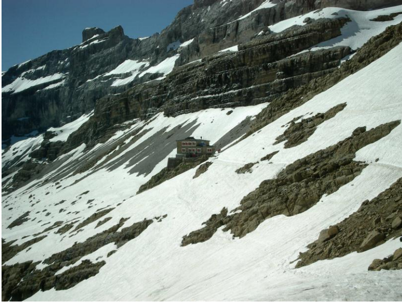
Refuge de Sarradets

Vandaag moet een hoogdag worden. We gaan naar de 'Breche de Roland' (2807 m). Er is veel sneeuw gevallen in maart en die is nog niet weg. Maar dit kan geen probleem vormen gezien de diep uitgesleten paden van alle voorgangers. In Spanje zou er geen sneeuw liggen. Om onze stapdag wat in te korten steken we bij het buitenkomen van de gîte onze duim op en het is onmiddellijk raak. Iedereen die hier voorbij komt is immers een wandelaar die zijn auto plaatst op de parking van de col des Tentes (2208 m). Nog 600 m te klimmen.