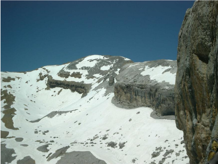
Geen sneeuw aan de Spaanse kant zegden ze!

boré' (3009 m). Dit wordt omdraaien en afdalen. De Spanjaarden stoppen even om hun crampons (ijzeren pinnen onder de schoenen) te bevestigen. Zij dalen gezwind, als berggeiten door de losse sneeuw; wij volgen voorzichtig. De kaart is van geen tel meer want de herkenningspunten zijn ondergesneeuwd. Wij bevinden ons honderden meter boven de bodem van de vallei, de mensen beneden zijn gelijk mieren. Op een bepaald ogenblik zit er een man te rusten op een rotsblok en staat er aan de overzijde een vrouw op een andere rotsblok. Links loopt er duidelijk een ingelopen pad de hoogte in.. Hij merkt dat we elk twee wandelstokken bij ons hebben, zegt dat zijn vriendin aan de overkant niet durft over te steken. Hij vraagt Jépé over te steken, zijn stokken te geven aan de vrouw waarna ik nadien zijn stokken kan meenemen.