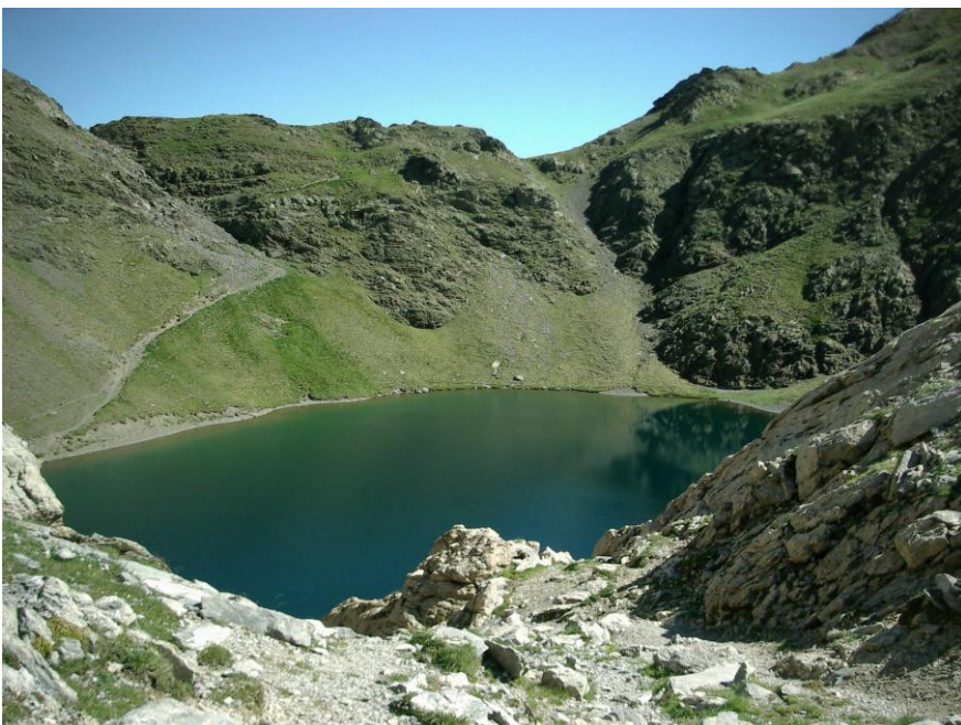
Ibon de Bernatuara

We beginnen onze klim naar de Puerto de Bernatuara (2336 m). Onze Puerto staat nergens aangegeven wel de Puerto de Boucharo. We weten echter dat dit pad afsplitst van het onze. We klimmen nu tussen dicht struikgewas en bomen steil omhoog regelmatig over rotsen. Het pad kronkelt naar boven. Geleidelijk werd het struikgewas opener en komen we in grasland terecht. Geen koetje te bespeuren. We steken de Barranco de Lapazosa over. Door een stuk