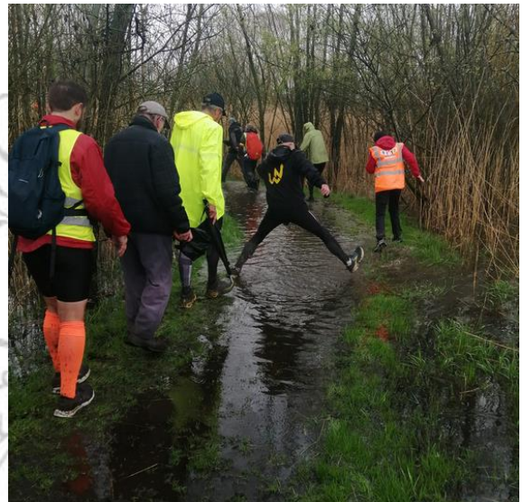
Euraudaxer die een spagaat ten beste geeft!

Gevolg: water, veel water! Verzopen paden, modder, ondergelopen weiden en na 2 km natte voeten. Een waar waterballet!